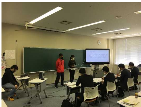
考案した井上ゼミ生（最終提案会の様子）